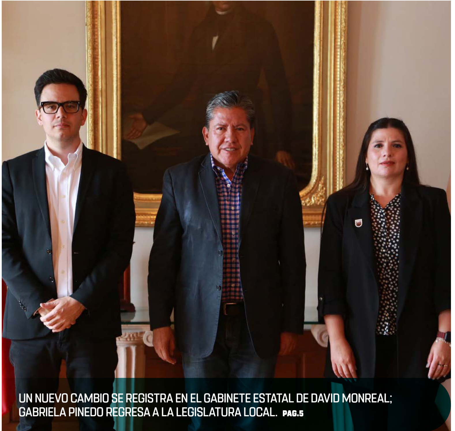
UN NUEVO CAMBIO SE REGISTRA EN EL GABINETE ESTATAL DE DAVID MONREAL; GABRIELA PINEDO REGRESA A LA LEGISLATURA LOCAL. PAG.5