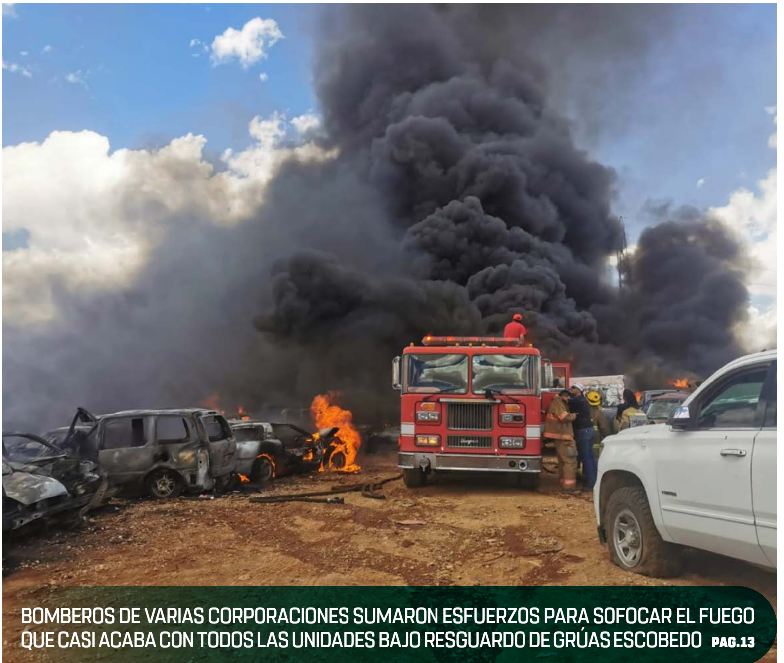
BOMBEROS DE VARIAS CORPORACIONES SUMARON ESFUERZOS PARA SOFOCAR EL FUEGO QUE CASI ACABA CON TODOS LAS UNIDADES BAJO RESGUARDO DE GRÚAS ESCOBEDO PAG.13