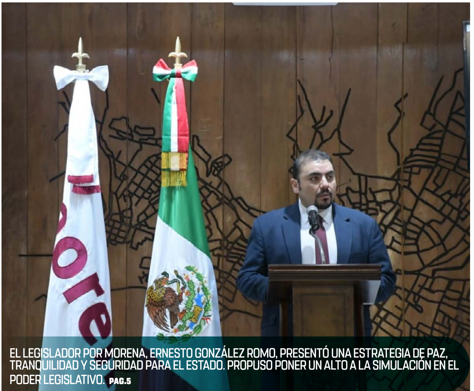
EL LEGISLADOR POR MORENA, ERNESTO GONZÁLEZ ROMO, PRESENTÓ UNA ESTRATEGIA DE PAZ, TRANQUILIDAD Y SEGURIDAD PARA EL ESTADO. PROPUSO PONER UN ALTO A LA SIMULACIÓN EN EL PODER LEGISLATIVO. PAG.5