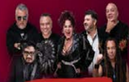
LO MEJOR DEL ROCK EN ESPAÑOL