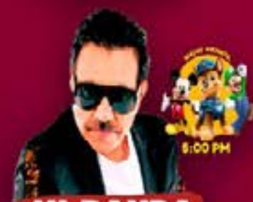
MI BANDA EL MEXICANO