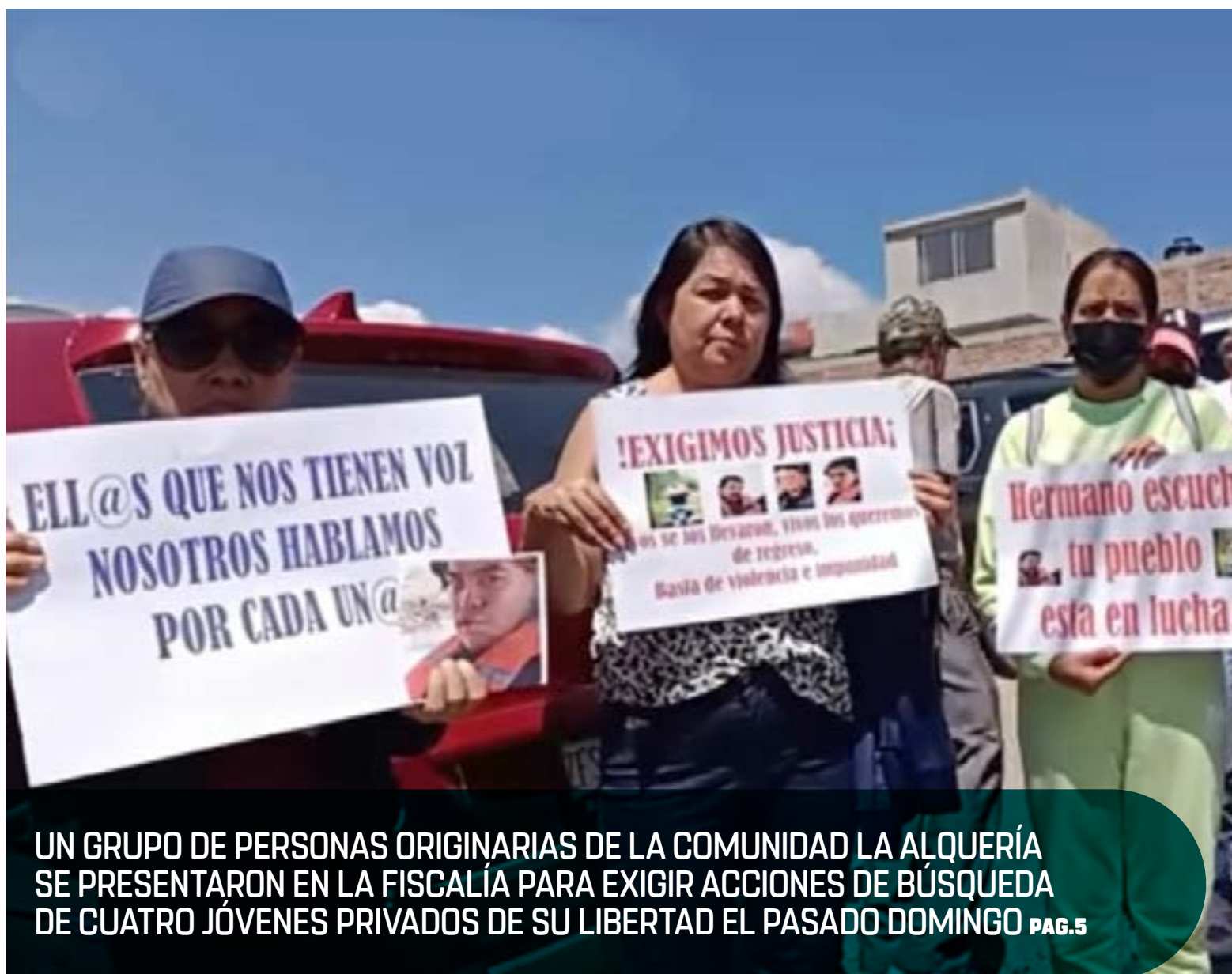
UN GRUPO DE PERSONAS ORIGINARIAS DE LA COMUNIDAD LA ALQUERÍA SE PRESENTARON EN LA FISCALÍA PARA EXIGIR ACCIONES DE BÚSQUEDA DE CUATRO JÓVENES PRIVADOS DE SU LIBERTAD EL PASADO DOMINGO PAG.5