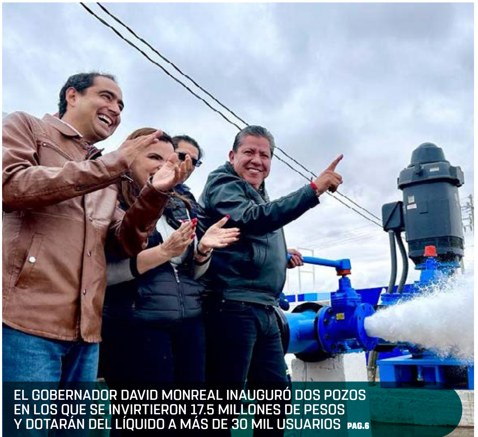
EL GOBERNADOR DAVID MONREAL INAUGURÓ DOS POZOS EN LOS QUE SE INVIRTIERON 17.5 MILLONES DE PESOS Y DOTARÁN DEL LÍQUIDO A MÁS DE 30 MIL USUARIOS PAG.6