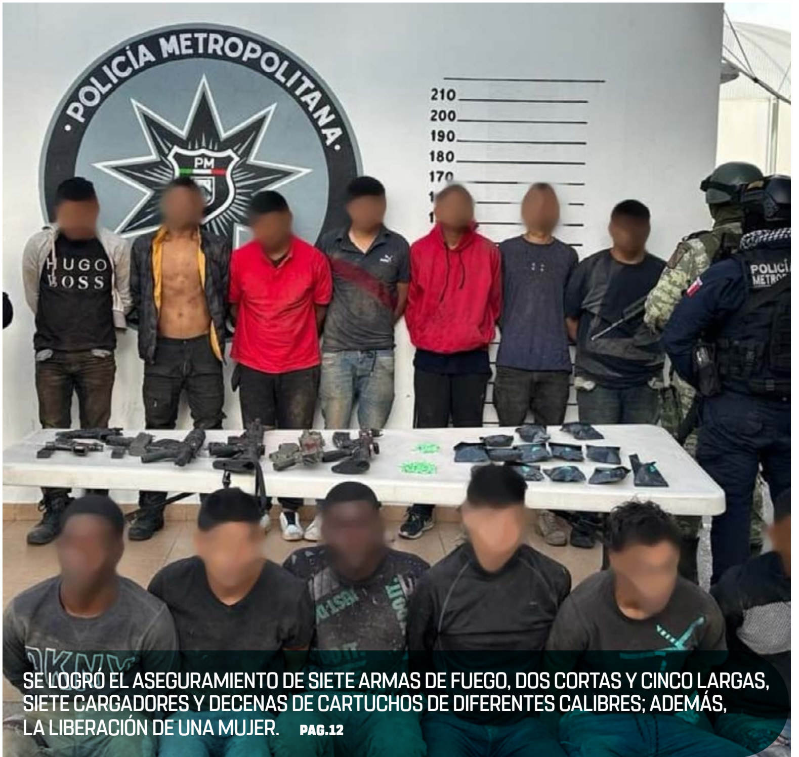
SE LOGRÓ EL ASEGURAMIENTO DE SIETE ARMAS DE FUEGO, DOS CORTAS Y CINCO LARGAS, SIETE CARGADORES Y DECENAS DE CARTUCHOS DE DIFERENTES CALIBRES; ADEMÁS, LA LIBERACIÓN DE UNA MUJER. PAG.12