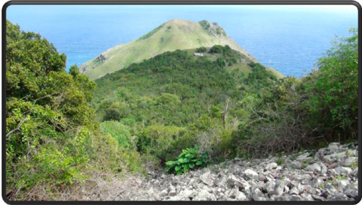
Spring Bay Flat, where archaeological excavations have uncovered ruins of sugar and indigo plantations, and remains of enslaved African houses and objects, mid-18 th century