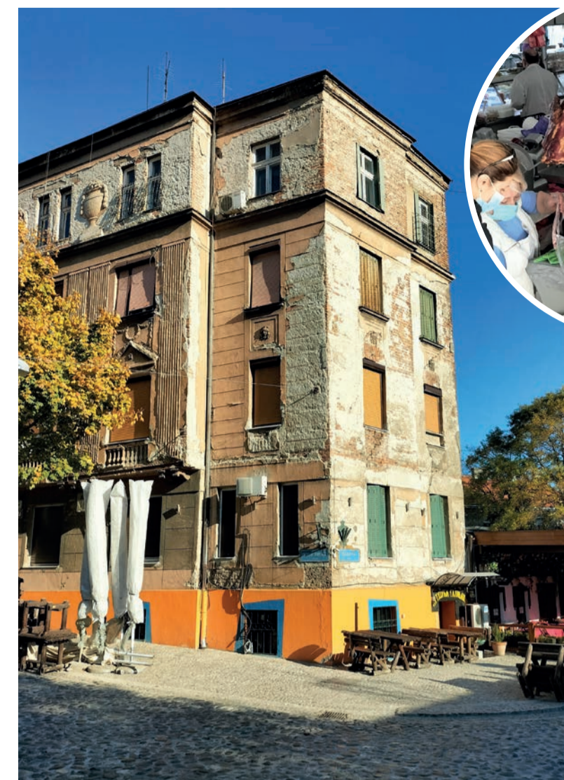
En af slagterboderne på Bajlonimarkedet, hvor røgværer er en af attraktionerne.