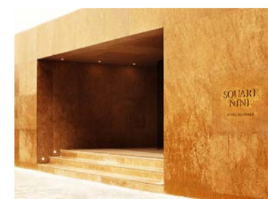
Indgangen til hotellet.

Hér skal – eller kan – vi bo, når vi er i Beograd!