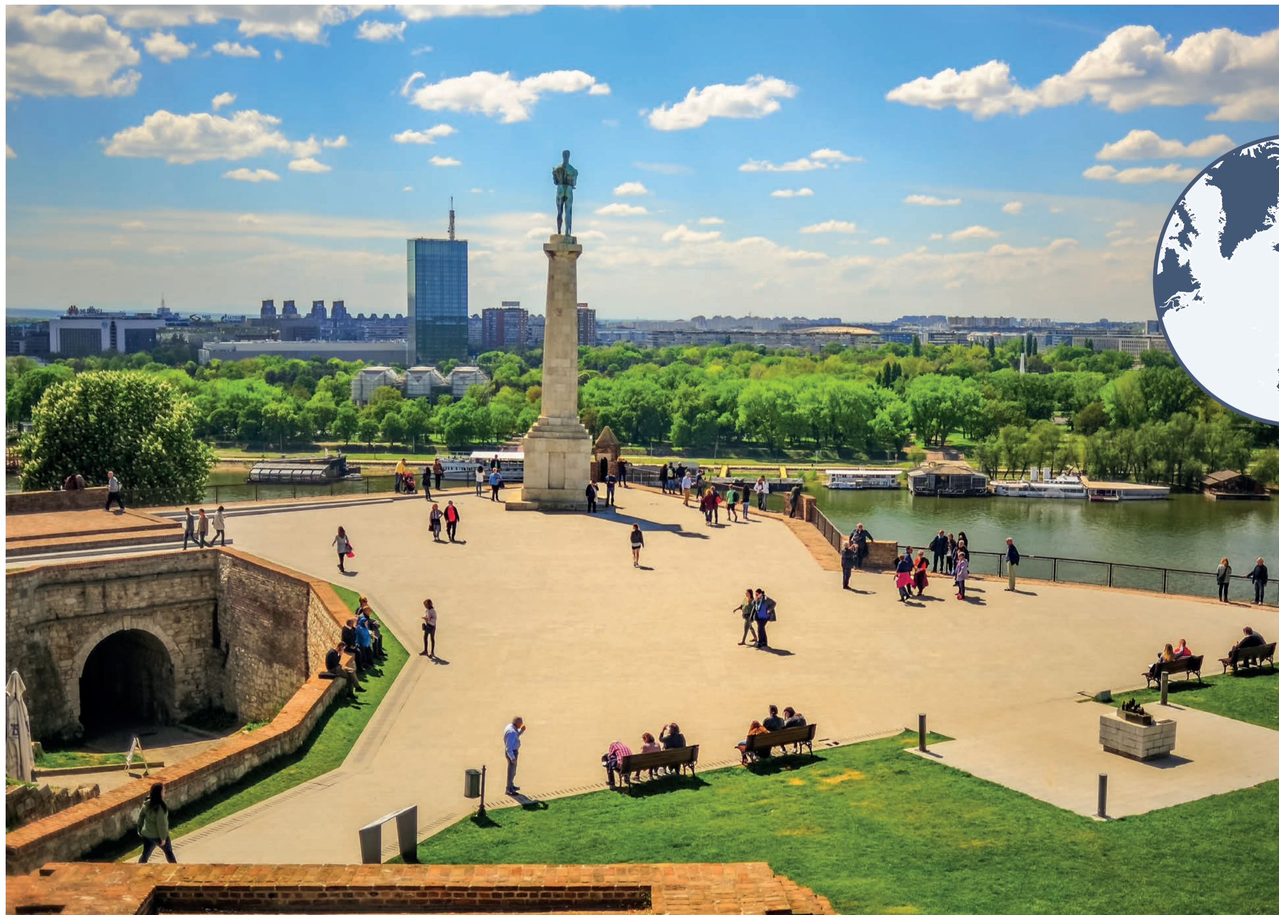
Udsigt over plateauet ved Kalemegdan borgen. Området er en magnet for gæster i Beograd.