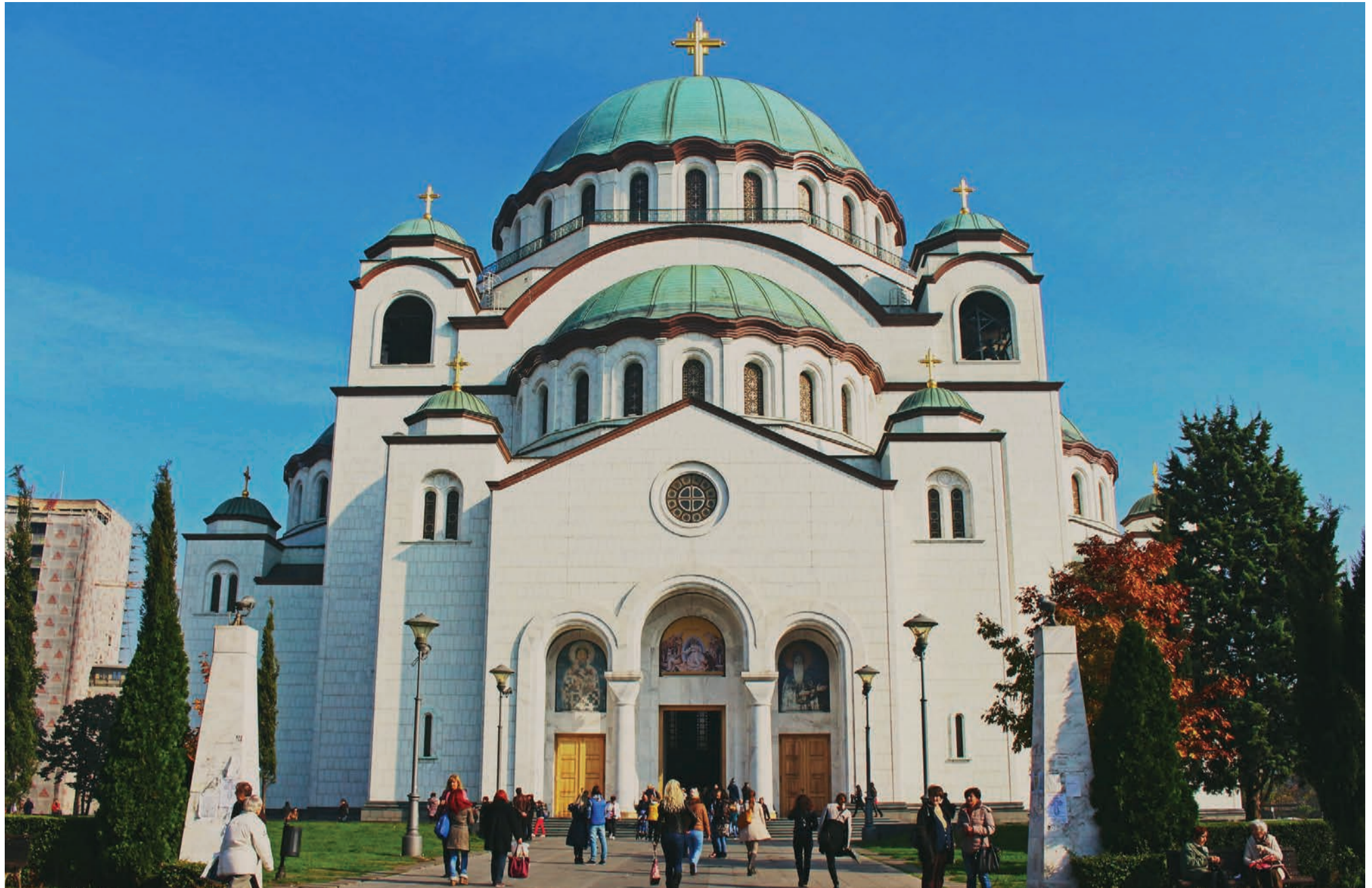
St. Sava katedralen er verdens største ortodokse kirke.