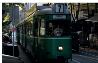
En af de gamle, charmerende sporvogne i det bakkede Vračar.

Vračar er lidt af et velhaverkvarter. I gaderne omkring Moment kan man skimte velstanden, når øjnene falder på de fine (lidt slidte) og meget store villaer, og man får også et lille strejf af både Friedrichstraße og Champs-Élysées, når man slentrer op ad Bu-