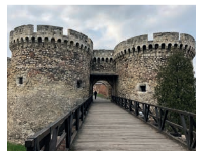
Portparti fra 1690 på Kalemegdan borgen.

Ordene 'Kale' og 'Megdan' er begge osmanniske og betyder hver især 'fæstning' og 'slagmark'. Her har nogle af den europæiske histories store bataljer med andre ord udspillet sig – ved to store floder, mellem øst og vest. Tag endelig turen helt ud på kanten af citadellet og nyd udsigten, der er det kystløse Serbiens svar på Grenen – her møder floderne Sava og Der Schönen Blauen Donau hinanden.