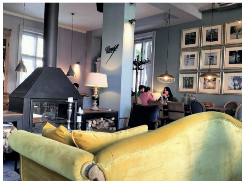
Smokvica er indrettet som en smagfuld dagligestue.

levar kralja Aleksandra. Boulevarden er 7,5 kilometer lang, men tag bare et kvarters tid på den serbiske high street, før du igen springer på en TX-taxi for en slik for at spise megalækker frokost på De Små Figner, eller Smokvica, som de siger på serbisk.