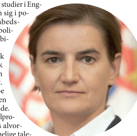
Ana Brnabic, Serbiens premierminister.

Man mærker et stik af i hvert fald platonisk forelskelse, når man oplever Ana Brnabic. Find hende på Youtube – hun er eksplosiv, men på den stilfærdige måde. De mørke øjne. Det velproportionerede ansigtsalvorlige træk. Den ustoppelige talestrøm på et engelsk med slet skjult slavisk accent. De bevagede budskaber, ideer, visioner og politiske mål formidlet med en misundelsesværdig