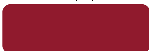
(122) Exotic Red