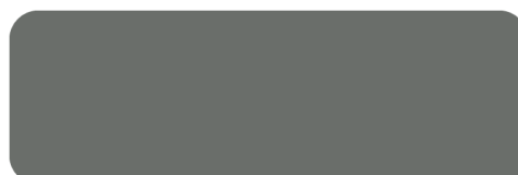
(506) Dusty Grey