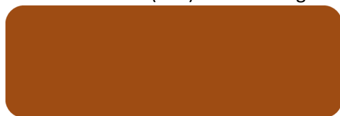
*(124) Autumn Leaves