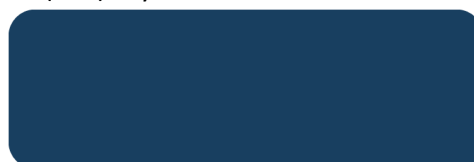
(309) Capri Blue