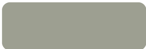
(504) Light Grey