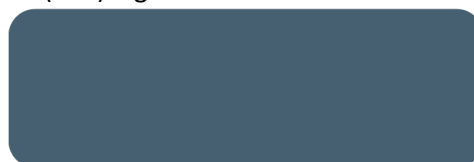
(306) Steel Blue