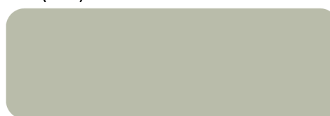
(521) Dolphin Grey