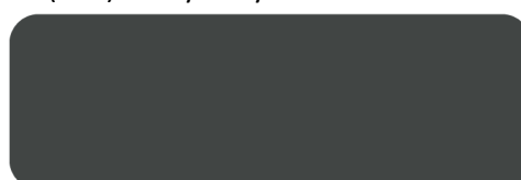
(507) Iron Grey