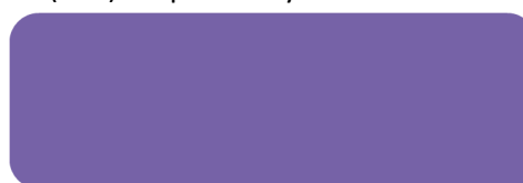
(321) Wild Orchid