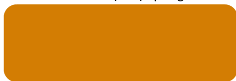
*(125) Dutch Orange