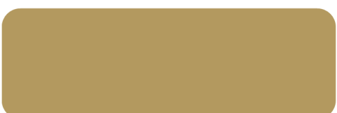
(205) Light Brown