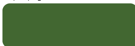
(402) Dark Green