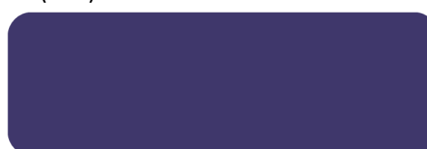
(322) Mystical Grape