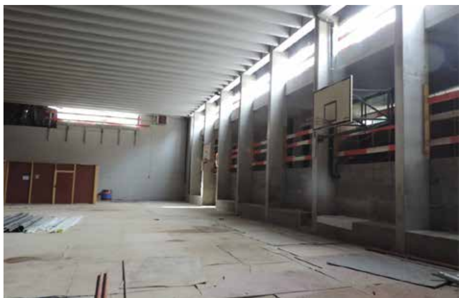
Rénovation salle primeur