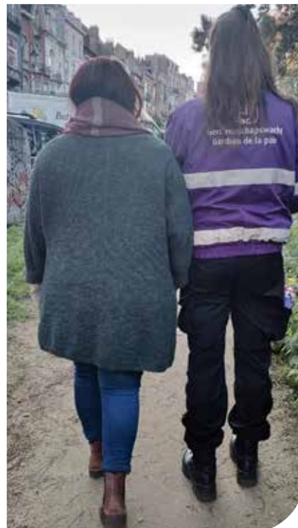
Ronde quotidienne des gardiens de la paix

Nous aurions également aimé lancer une journée de la vie associative , la situation sanitaire ne nous a pas permis de la réaliser dans de bonnes conditions. Ce n'est que partie remise. Mais afin d'aider également les associations de terrain,