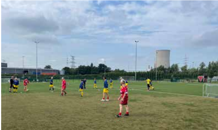
Football en marchant

« Je cours pour ma forme » ou encore le « Mercredi du stade » sont deux autres exemples de projets dédiés à favoriser la pratique sportive pour l'ensemble des citoyens forestois.