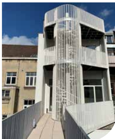
Rénovation crèche boutchics