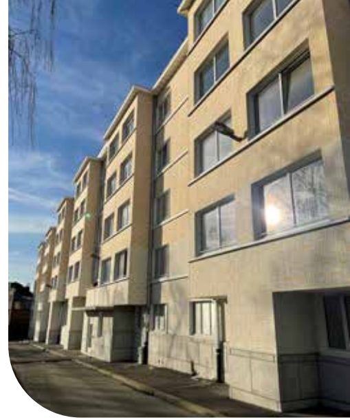
Rénovation des blocs jaunes

Construction et rénovation ne sont pas les seules réalisations du Foyer du Sud. Une attention particulière est portée sur les locataires. En effet, une première analyse de satisfaction des locataires a été élaborée, un ingénieur a été chargé d'optimiser la consommation d'énergie du patrimoine afin de diminuer les coûts à charge des locataires et un suivi des personnes isolées dans le cadre du confinement est assuré.