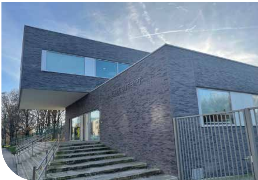
École du Bempt

Nous avons également continué à travailler sur la rénovation de nos structures pour la petite enfance . Le Bercail , les Bout'chics et la Ruche ont été entièrement rénovées. Dans le cadre du contrat de quartier Albert, la crèche les Bout'chics a été agrandie et passe d'un accueil de 20 à 36 enfants. La Ruche quant à elle est également rénovée et sa capacité est passée de 36 à 42 places. Nous avons également pu ouvrir les portes de la nouvelle crèche Diversity qui comprend 36 places, portant à 9 le nombre de crèches communales. Avec une prochaine augmentation de la capacité à la crèche du Bercail forestois (de 42 à 48 places), et un projet de construction d'une nouvelle crèche de 56 places à la