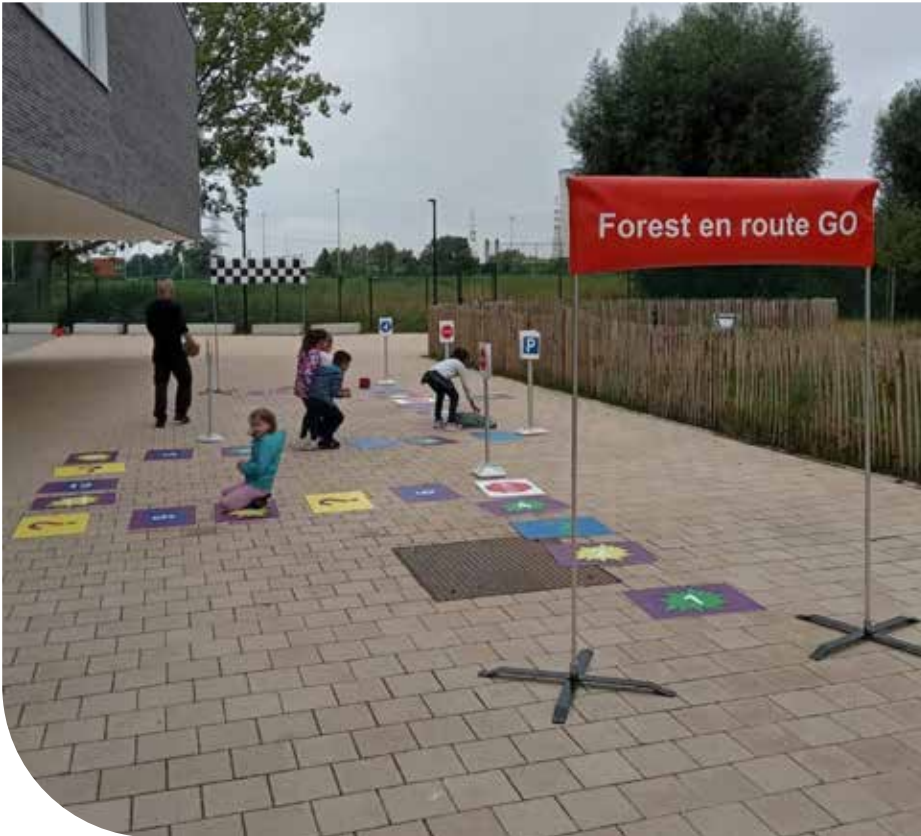
Initiation sécurité routière

nous avons organisé une formation gratuite en ligne sur la réforme des ASBL. Il est évident que ce n'est qu'un début et malgré les circonstances compliquées, celle-ci a eu un franc succès.