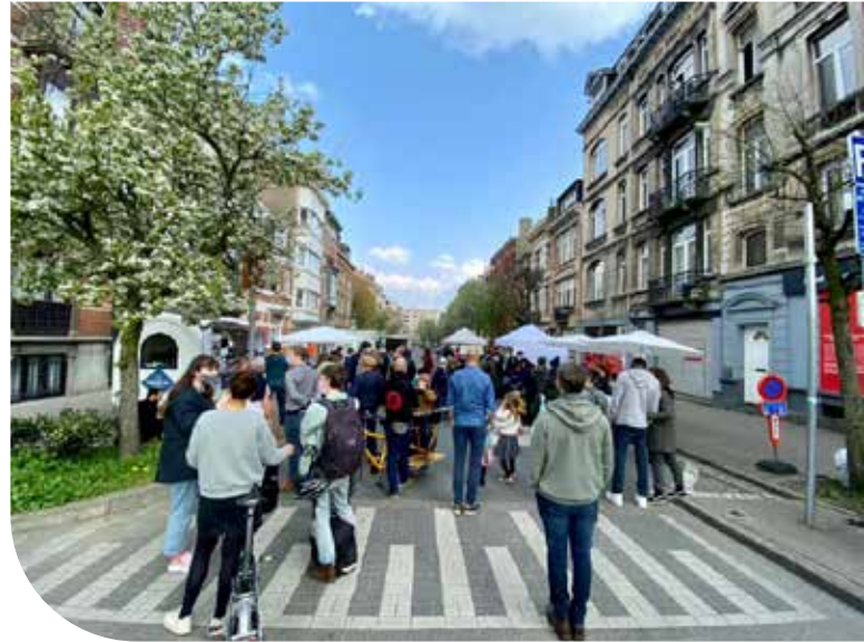
Marché Altitude 100

Une partie du mobilier urbain destiné à lutter contre la malpropreté, telles que les dalles cendriers, a pu être placée.