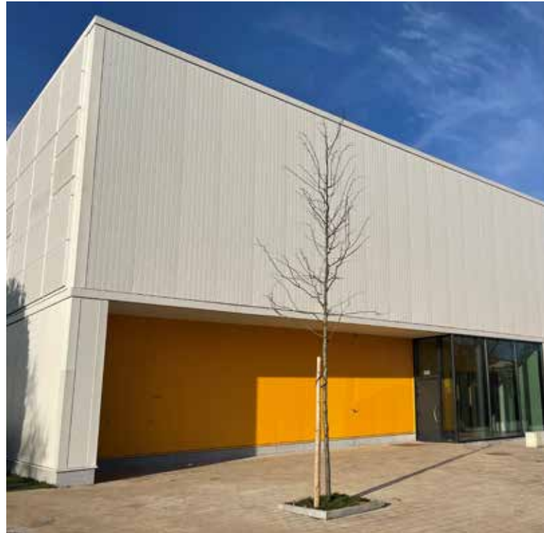
Nouvelle salle de gym/sport du Bempt

Il était important de développer de nouvelles salles et aussi d'entretenir nos infrastructures existantes. Deux nouvelles salles sont donc sorties de terre et ce grâce à un réel travail d'équipe: la salle du Bempt et le complexe