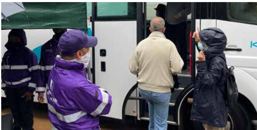
Présence aux événements

Nous continuerons à être à l'écoute de nos jeunes et à les aider au mieux pour qu'ils évoluent dans une commune qui leur plait et pour qu'ils trouvent leur place dans notre société. Ils sont notre avenir et nous serons toujours présents pour les aider au mieux, notamment en soutenant les équipes de terrain sans quoi rien ne serait possible.