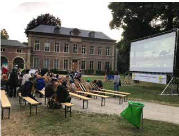
Cinéma plein air

Pour la compétence du commerce , il est évident que notre priorité a été de soutenir au mieux les commerçants durant ces longs mois de pandémie. Mais préalablement à cela, nous avions déjà