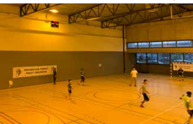
Tournoi de football avec les jeunes